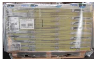
Pallet con estensibile